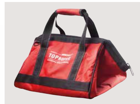
5 Pratica e robusta borsa in cordura per il trasporto Practical, sturdy Cordura fabric carrying bag