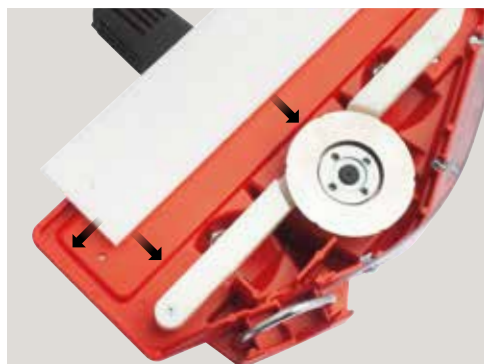
3 Base in nylon intercambiabile Interchangeable nylon base