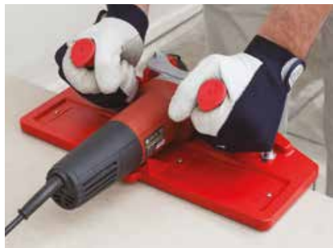
2 Impugnature ergonomiche Ergonomic grips

Dry profiling system for tiles and slabs, allows for the processing of miter cuts, bevels, radiused profiles on porcelain, ceramic and any stone material of any size.