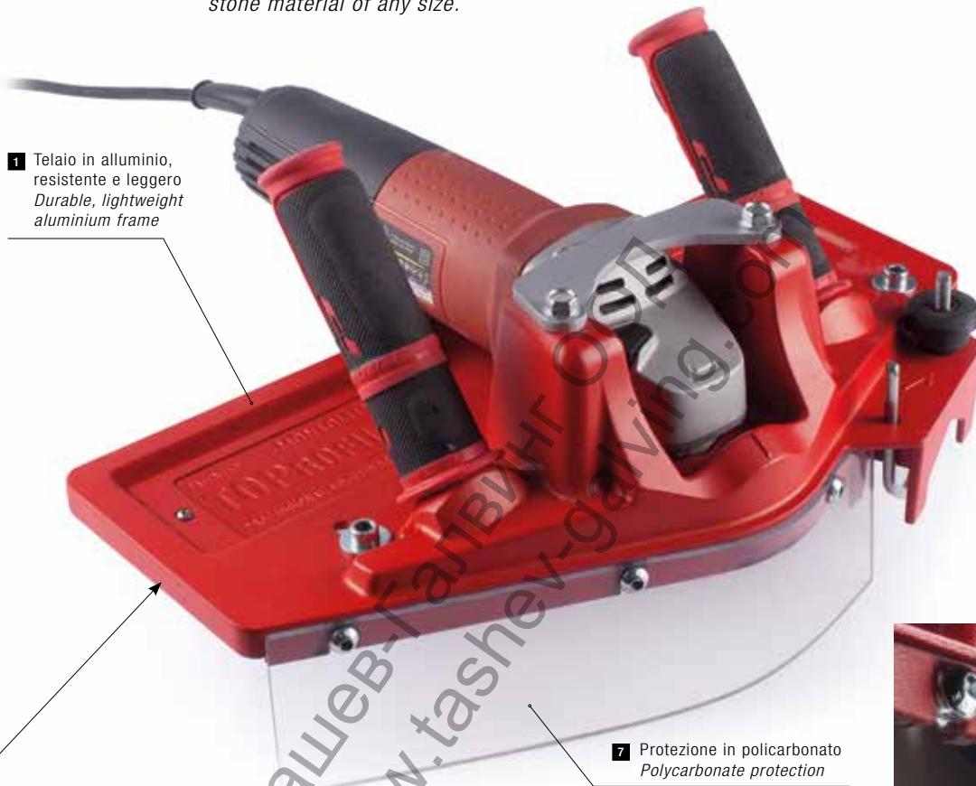
1 Telaio in alluminio, resistente e leggero Durable, lightweight aluminium frame