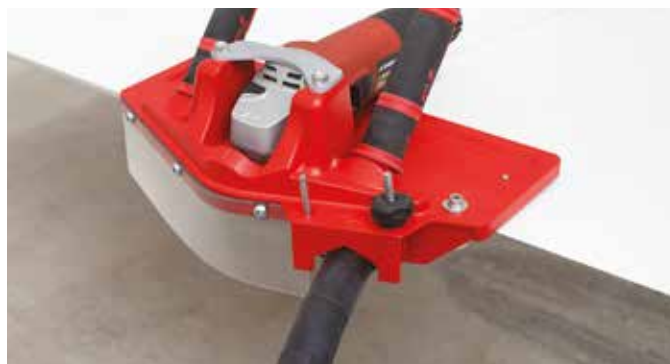
4 Attacco universale per aspirazione Universal vacuum connection