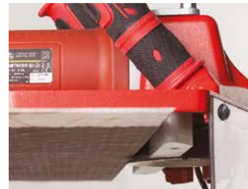
6 Smussature perfette Perfect chamfering